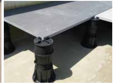
Ayarlanabilir yükseltilmiş döşeme ayakları